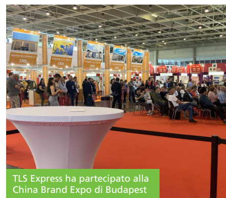
TLS Express ha partecipato alla China Brand Expo di Budapest

questo evento contribuiranno in modo significativo al successo a lungo termine di TLS Express".