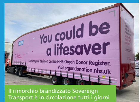
Il rimorchio brandizzato Sovereign Transport è in circolazione tutti i giorni

"La fortuna ha voluto che avessimo appena ordinato un nuovo veicolo quando siamo stati contattati dall'NHS e abbiamo deciso che esporre la pubblicità sulla donazione di organi, al posto del nostro marchio, ci avrebbe permesso di fare la nostra parte nel diffondere questo messaggio fondamentale a livello nazionale".