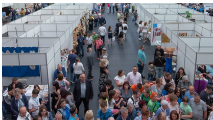
La partecipazione alla Kiskun Expo ha permesso a Rollsped di far conoscere i suoi servizi Palletways a un vasto pubblico

L'Expo di Kiskun, che si tiene a Kiskunfélegyháza, in Ungheria, celebra il ricco patrimonio culturale ed economico della regione e quest'anno fa parte del Festival tradizionale e culturale della Settimana dei Fondatori della città.