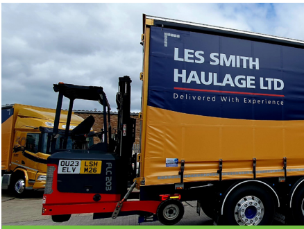
Les Smith Haulage ha investito 4 milioni di sterline per soddisfare l'aumento della domanda di servizio