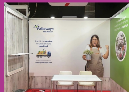
Palletways Italia è stata sponsor tecnico e partner logistico al Buyer Point 2024

aziende vinicole in diversi comuni italiani, principalmente in Emilia-Romagna. Il festival, che unisce l'amore per il cinema ai vini locali, è iniziato a giugno a Casa Spadoni a Faenza concludendosi a fine agosto.