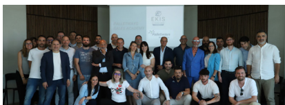
Palletways Italia ha recentemente lanciato il suo secondo corso Sales Academy a supporto dei Concessionari.

Dopo il successo dello scorso anno, Palletways Italia ha recentemente lanciato la seconda edizione della sua Sales Academy. In collaborazione con un partner specializzato, ha offerto una formazione a supporto dei Concessionari del Network, con l'obiettivo di aiutarli a migliorare il loro approccio commerciale.