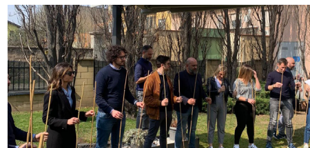
I partecipanti hanno avuto l'opportunità di migliorare le loro capacità imprenditoriali, di fare rete e di migliorare le relazioni con gli altri Concessionari.

"L'iniziativa ha avuto un tale successo e il feedback degli ospiti è stato così positivo che abbiamo intenzione di lanciare una terza edizione di corsi di formazione nel prossimo futuro".